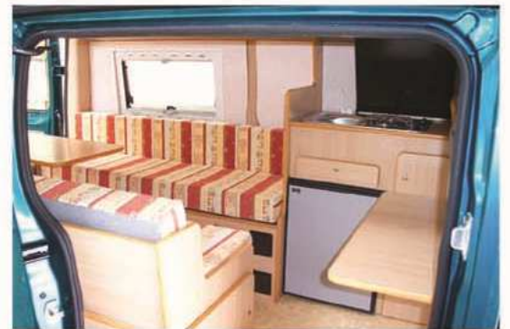
SAHARA version 1