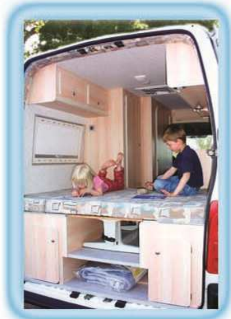
AUSTRAL Version 2