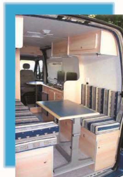
AUSTRAL Version 1 AUSTRAL Version 3